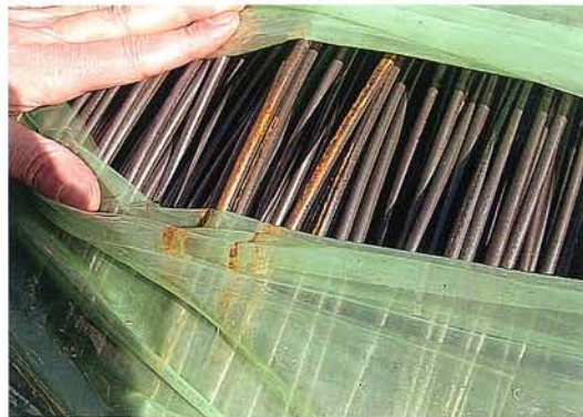
Ware nach Transport ohne VCI-Schutz