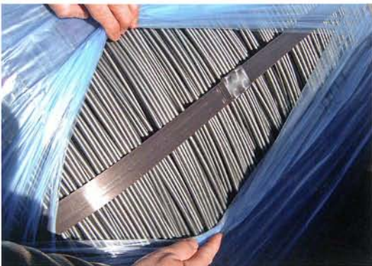
Ware nach Transport mit VCI-Schutz